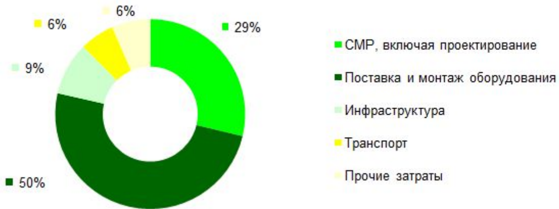
Рис.3. Структура инвестиций